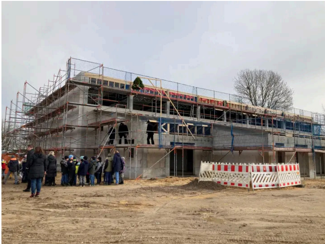
Die neue Zweifeld-Sporthalle in Sukow wird barrierefrei gebaut

Die neue Zweifeld-Sporthalle wird barrierefrei gebaut und erhält einen Zuschauerbereich mit 76 Plätzen. Insgesamt wird sie rund 1400 Quadratmeter groß. Die Beheizung erfolgt über das vorhandene Blockheizkraftwerk der benachbarten Biogasanlage und die Stromerzeugung über eine auf dem Dach geplante PV-Anlage, informierte Architekt Frank Albers aus Gädebehn bereits bei der Grundsteinlegung.